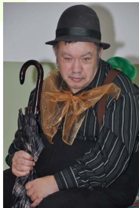
Kiełbasa, makaron i ryż...

Obecnego rządu i Prezydenta. Zmienić rząd!